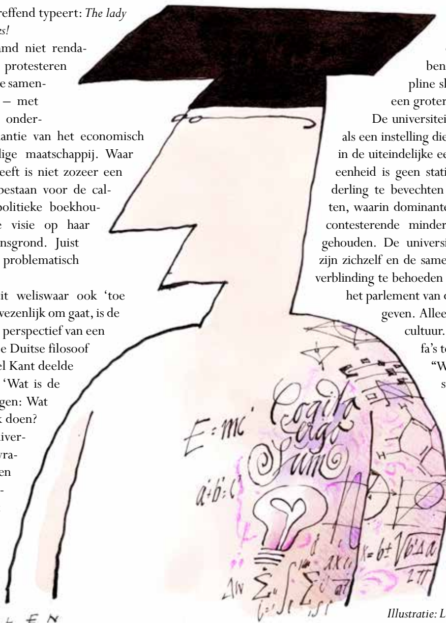
Illustratie: Len Munnik