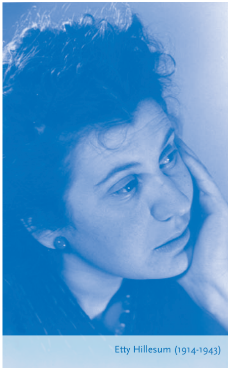
Etty Hillesum (1914-1943)