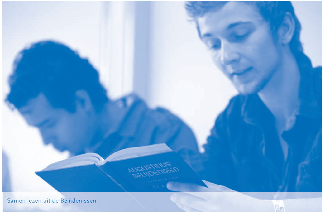
Samen lezen uit de Belijdenissen

Ik was onder de indruk van mijn medestudenten en heb genoten van alle sprekers. Wat een aardigheid, belezenheid en diepgang bij