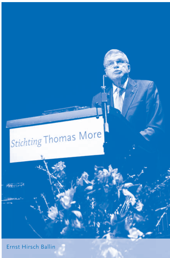
Ernst Hirsch Ballin

het vonnis niet aldus kunnen worden gewezen. Zou het toch aldus zijn geweest, dan had een klacht bij het Europese Hof voor de Rechten van de Mens hem het schavot kunnen besparen.”