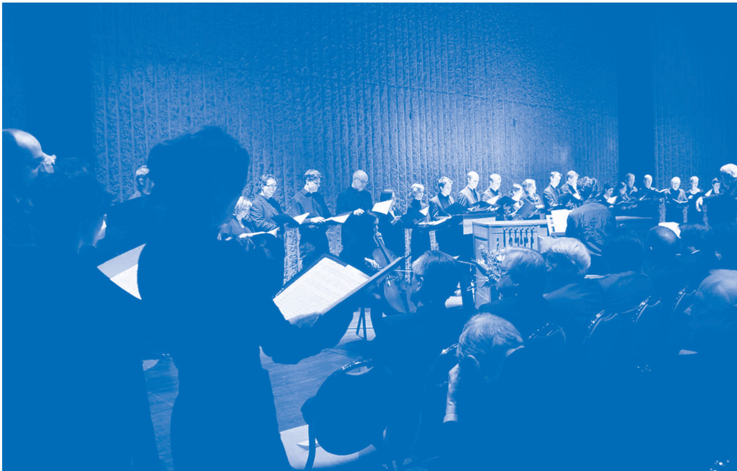
Uitvoering van het koorwerk van Tallis

De hoofdvraag van Hirsch Ballins lezing was hoe deze gewetensvrijheid zich tot het recht verhoudt – een ingewikkelde, en blijvend relevante vraag. Je zou, zo stelde de spreker, het moderne denken over universele mensenrechten als de “juridisering van de gewetensfunctie ten opzichte van het recht” kunnen zien. “Had Thomas More zich voor zijn rechters kunnen beroepen op zijn grondrechten van godsdienstvrijheid en vrijheid van meningsuiting, dan was de betreffende Act of Parliament buiten toepassing gelaten en had